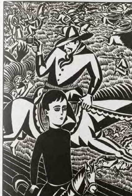
Le Chêne de bois, 1922, gravure sur bois, 27 x 20 cm, épreuve d'état, double au coup de papier - A. Stary - (Thea Sternberg), coll. privée