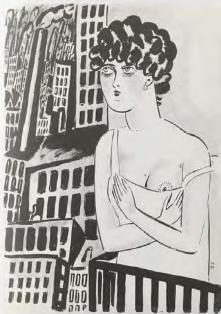
Formes au balcon, 1921, encres de Chine sur papier, 65,5 x 71 cm, coll. privée