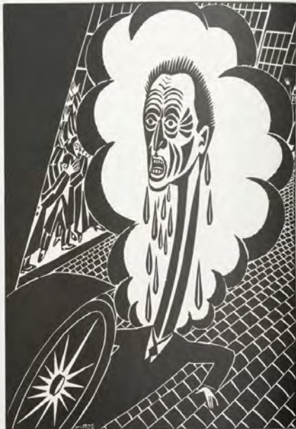
L'Enfer, 1922, gravure sur bois, 27 x 20 cm, épreuve d'état, coll. privée