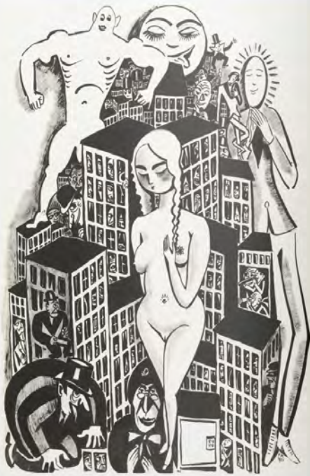
La Débâcle, 1921, encres de Chine sur papier, 65 x 51 cm, coll. privée